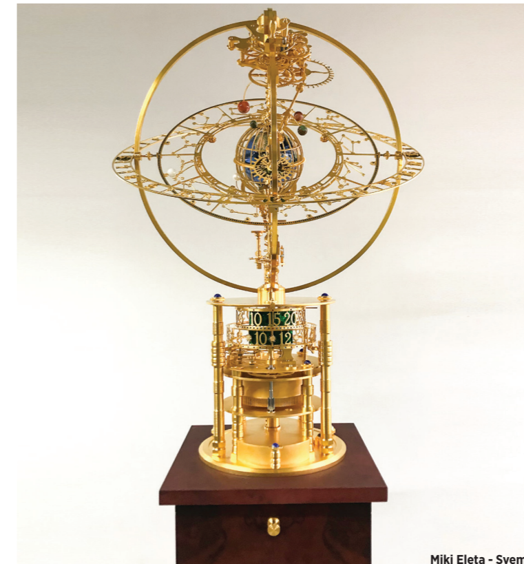
Miki Eleta - Svemir

Sunt foarte importante! Aproximativ o treime din ceasurile mele sunt făcute pe comandă. Îmi place să fac asta pentru că ridică noi provocări. Caut să înțeleg dorințele clientului, lucrurile ce-l